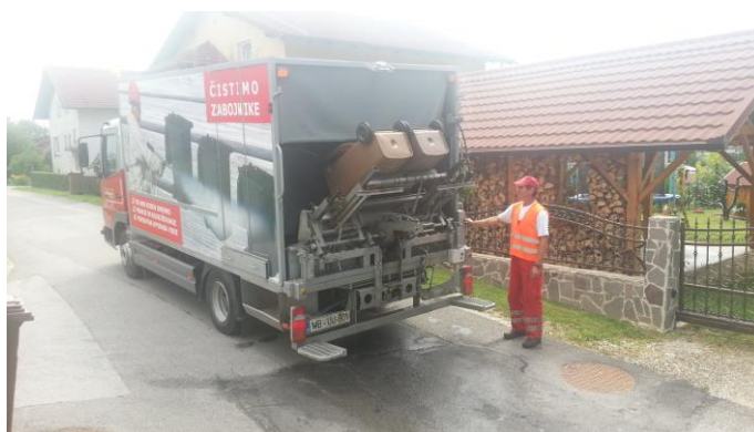
Slika 11: Vozilo za pranje zabojnikov za zbiranje odpadkov

Izvajalec prevzema in prevaža odpadke s posebnimi vozili in opremo, ki zagotavljajo praznjenje embalaže za zbiranje odpadkov, nalaganje odpadkov, njihov prevoz in razlaganje brez prahu, čezmernega hrupa ter raztresanja oz. razlitja odpadkov. Če pride pri prevzemanju odpadkov do onesnaženja prevzemnega mesta oziroma mesta praznjenja embalaže in nalaganja odpadkov ali njihove okolice, mora izvajalec zbiranja komunalnih odpadkov na svoje stroške zagotoviti odstranitev teh odpadkov ter očistiti onesnažene površine.