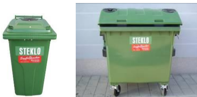
Slika 8: Namenska embalaža za zbiranje steklene embalaže