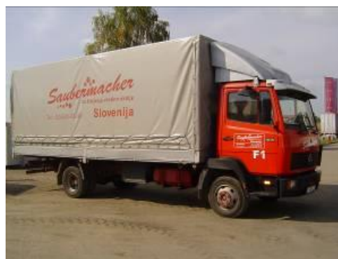
Slika 7: Namenska embalaža in specialno vozilo za zbiranje kosovnih odpadkov