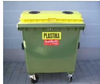
Slika 5: Namenska embalaža za zbiranje plastične, kovinske, sestavljen in mešane embalaže