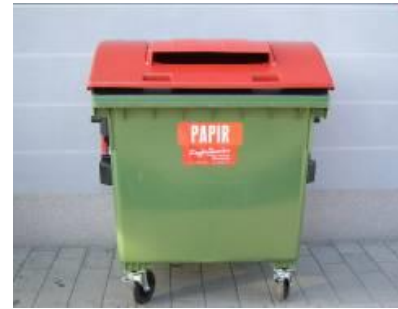
Slika 4: Namenska embalaža za zbiranje papirja in papirne embalaže