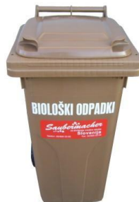
Slika 6: Namenska embalaža za zbiranje biorazgradljivih odpadkov