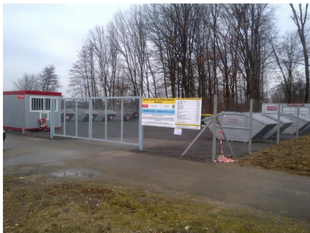
Slika 9: Zbirni center ločenih frakcij Radenci

Zbirni center ločenih frakcij se nahaja v naselju Boračeva, na lokaciji pri stari žagi, parc. št. 55/3 in 55/5, k.o. Boračeva.