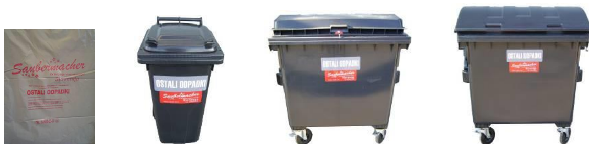
Slika 3: Namenska embalaža za zbiranje mešanih komunalnih odpadkov