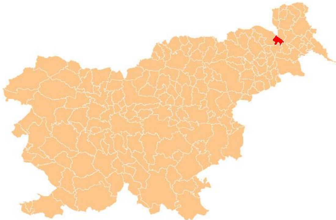
Slika 2: Lega Občine Radenci v Republiki Sloveniji 4