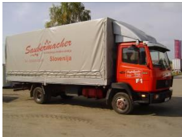
Slika 10: Premična zbiralnica nevarnih frakcij

O času, načinu in lokacijah zbiranja nevarnih odpadkov bodo povzročitelji obveščeni v pisni obliki najmanj 14 dni pred začetkom zbiranja.